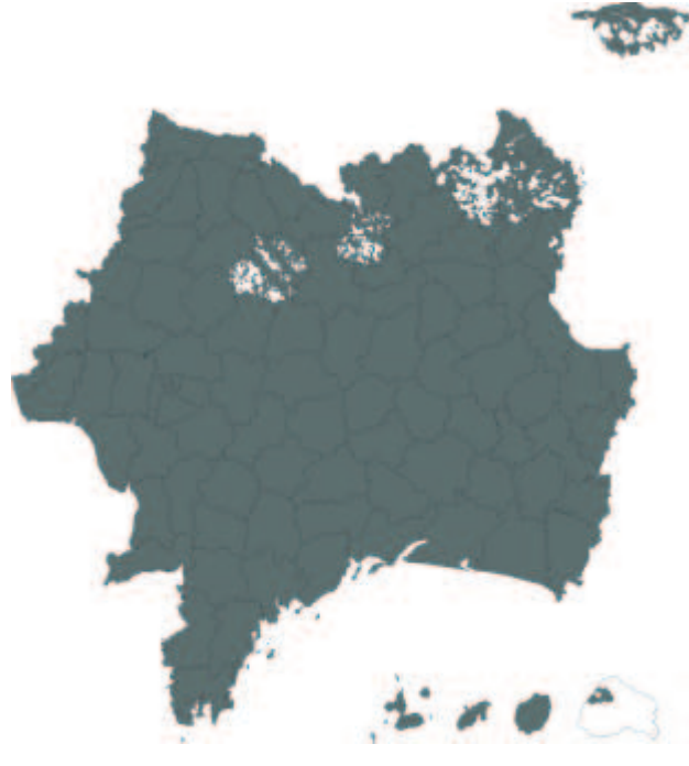
carte des communes de France ayant fait l'objet depuis 1982 d'un ou plusieurs arrêtés de reconnaissance de l'état de catastrophes